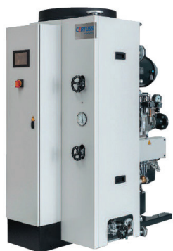
schéma vyznačuje hraniční body při dodávce technologie parních vyvíječů řady CERTUSS Junior TC: